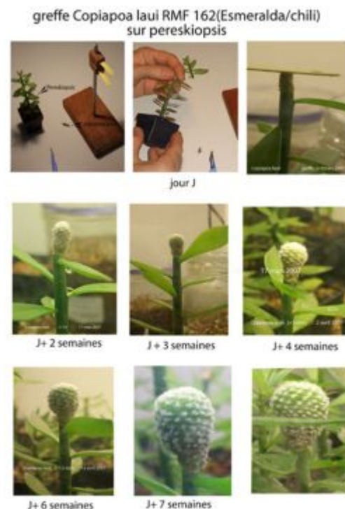
Copiapoa laui RMF 162 : sept premières semaines de croissance →